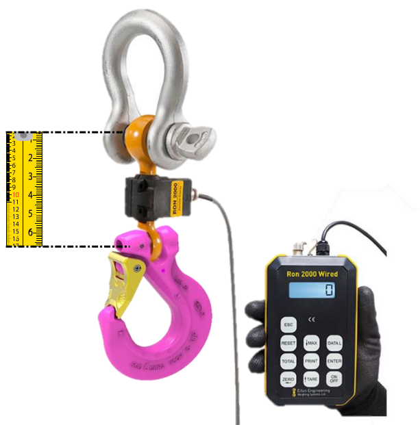
シャックル・フックは別売り